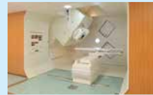
陽子線治療装置(回転ガンジー照射室)