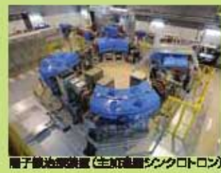
陽子線治療装置(生体組織シンクロトロン)