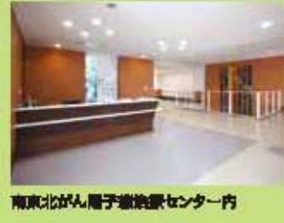
南東北がん陽子線治療センター内