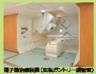
陽子線治療装置(回転ガンテリ)搬送室

※講演は、都合により開演、演題、時間など変更になる場合があります。ご了承ください。