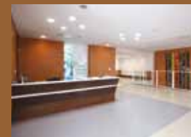
南東北がん陽子線 治療センター内