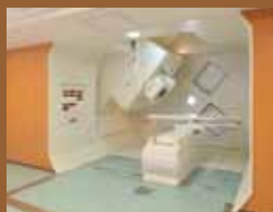
陽子線治療装置 (回転ガントリー照射室)

〈健診モニター内容〉フルコース(PET、MRI、エコー、血液検査、BMI) ※PETと各種画像検査、血液検査を組み合わせて、がんの発見率を高めることを目的とした総合的ながんドッグコースです。